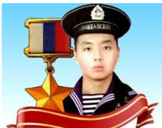
Вечер памяти «Герой страны – Алдар Цыденжапов» в ЦГБ.