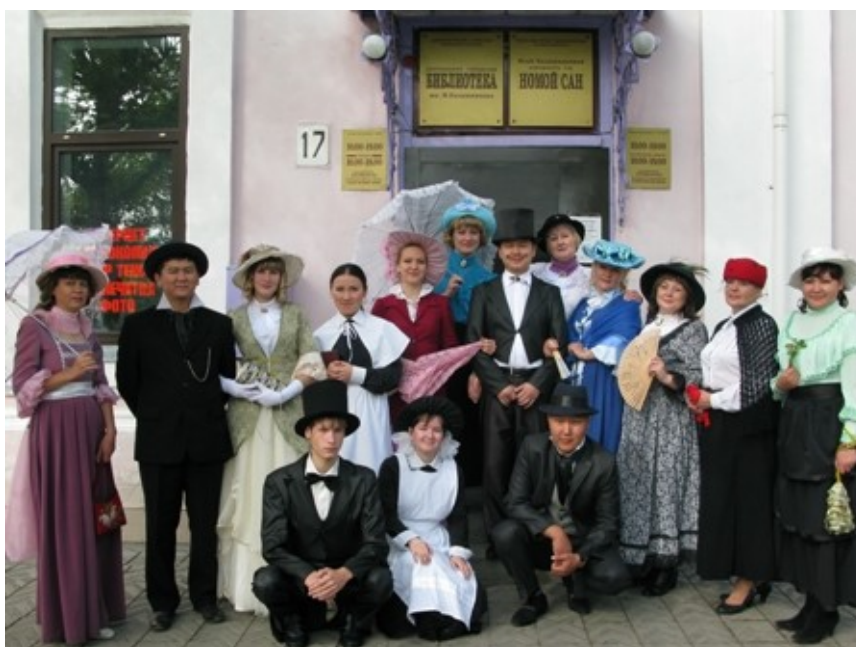
У стен родной библиотеки