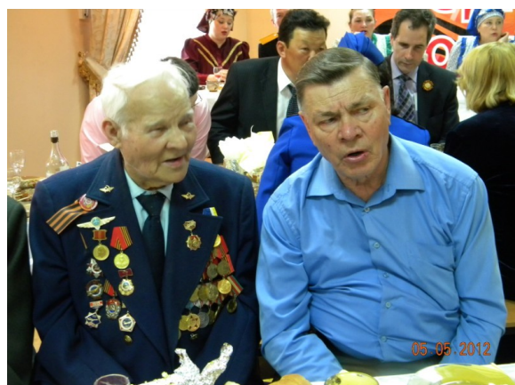
День Победы! Ветераны мкр. Аэропорт. Фил. № 20