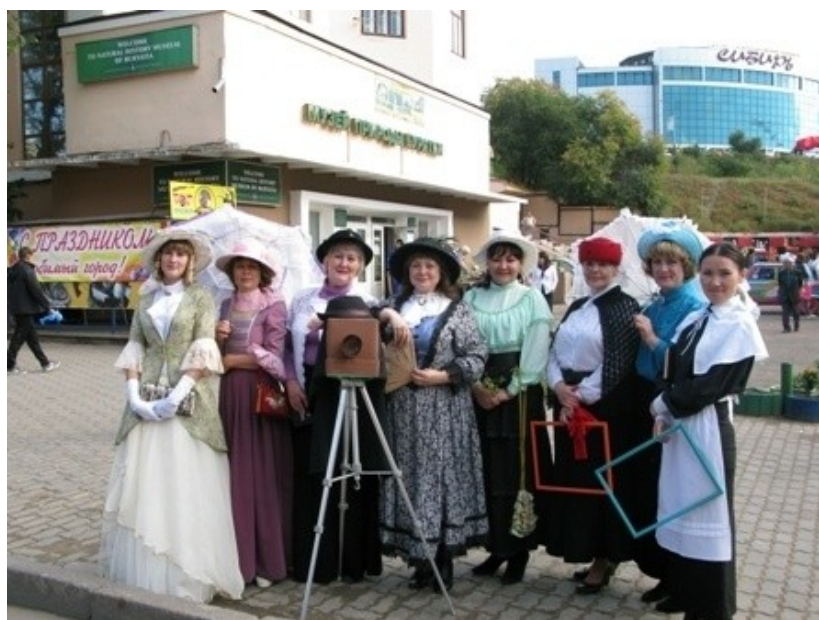
День города. «Городская интеллигенция» г. Верхнеудинска – как будто сошла со старых фотографий...