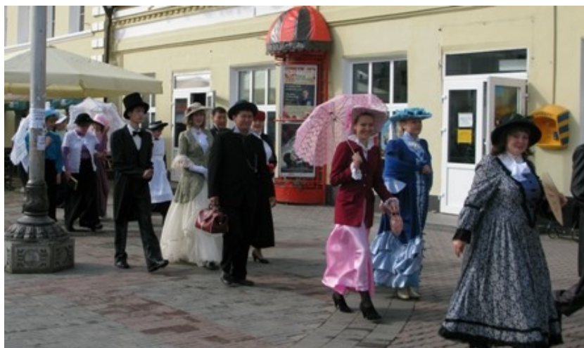
Шествие по Арбату