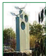
Каралезская долина, селение Красный Мак, близ дороги Бахчисарай